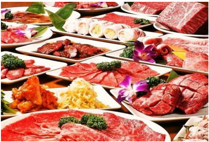
(餐廳餐食為示意圖，僅供參考，餐食以現場實際為準。)