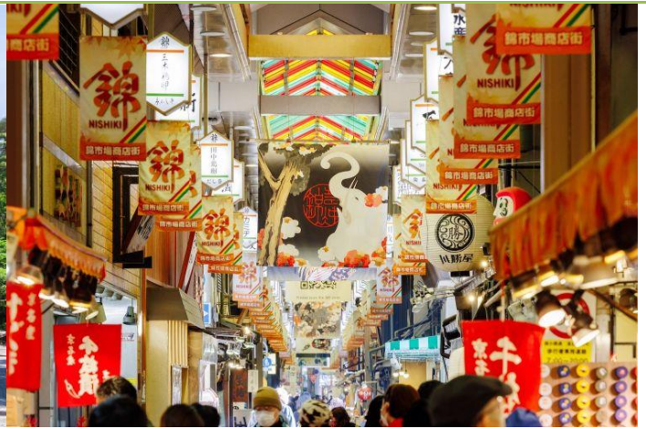
【國產和牛日式涮涮鍋+軟性飲料】